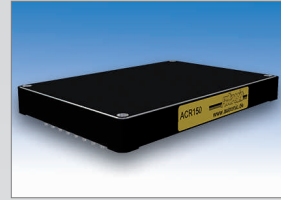
ACR150 150 W DC/DC