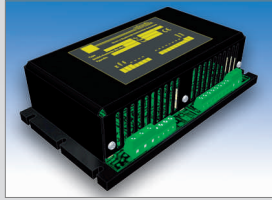
ACR350 350 W DC/DC